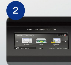
3.7"中文彩色觸控螢幕*