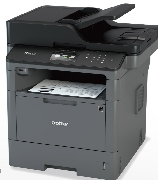
MFC - L5700DN