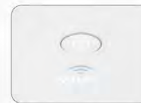
無線及 GB 級乙太網路連接