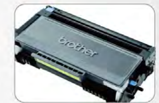
可列印達20,000張的特級海量碳粉匣