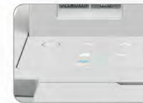
簡單好用的控制面板