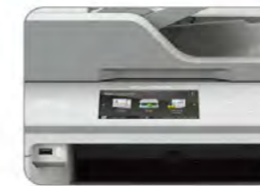
4.85" 中文彩色觸控螢幕