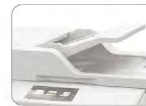
雙面 CIS 自動送紙器