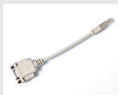
PA-SCA-001 RJ25 to DB9M 連接線