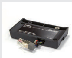
PA-BI-002 藍牙™ Wireless Technology 介面