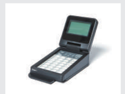
PA-TDU-003 觸控面板及螢幕 (可供 標籤機單機操作，僅 限於PT-P950NW使用)